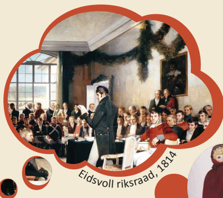
Eidsvoll riksråd, 1814

Deltagelsen kan integreres i grunnlovsfeiringen på en kreativ, fordypende og reflekterende måte. Til inspirasjon og hjelp vil lærerne få pedagogiske tips og nyttige lenker. Det er naturlig at arbeidet på skolen innledes med å reflektere over hvordan livet var i Norge rundt i 1814.