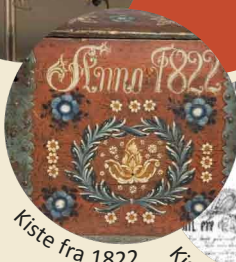
Kiste fra 1822