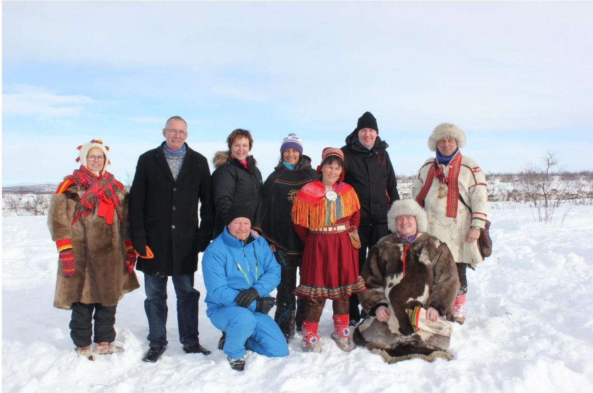
Den arktiske delegasjonen besøker reindrift på Finnmarksvidda.