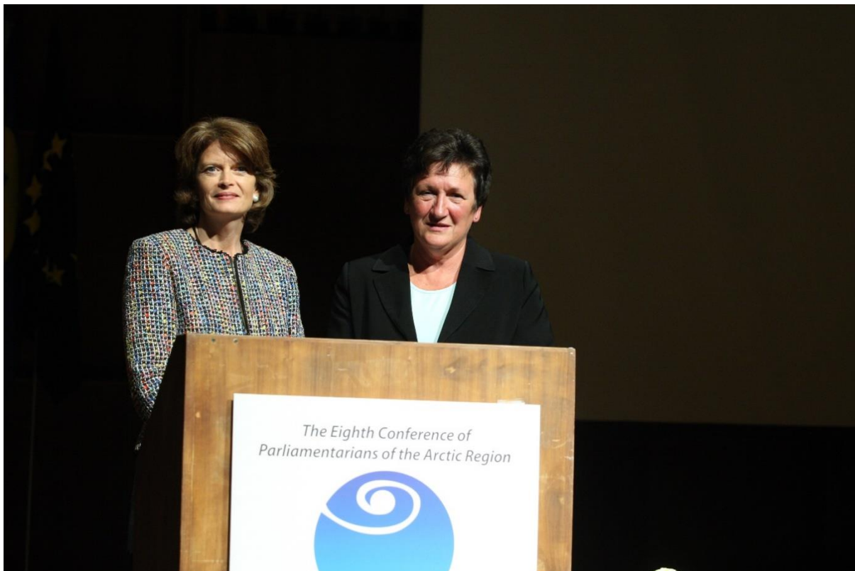
Senator Lisa Murkowski, USA og Hill-Marta Solberg, Norge og leder av den arktiske parlamentarikerkomiteen, på den 8. arktiske parlamentarikerkonferansen i Fairbanks i august 2008.

De siste to årene har det vært gjort en særlig innsats for å utvide USAs deltakelse i Den arktiske parlamentarikerkomiteen og gjøre deltakelsen fra USA mindre sårbart. Leder av komiteen har flere ganger vært i USA for å møte medlemmer av Kongressen. Det er etablert kontakt med lederen for «Arctic Caucus» i Representantenes Hus, og senator Murkowski har arbeidet for å inkludere flere senatorer i komiteens møter. Arbeidet ser ut til å bære frukter. Ved komiteens møte i Ottawa i mai 2019 deltok fem senatorer, og da komiteens leder besøkte Washington D.C. i desember 2019 hadde han møte med fire senatorer. Økt oppmerksomhet rundt klimaendringer, havnivåstigning og strategiske interesser i Arktis ser ut til å bidra til at flere medlemmer av Kongressen ønsker å engasjere seg i samarbeidet. Det blir viktig å utnytte det momentumet som nå er for å få en god deltakelse fra Kongressen på kommende møter og konferanser. Dette arbeidet viser også behovet for å åpne for flere medlemmer til komiteens møter, jf. diskusjonen over.