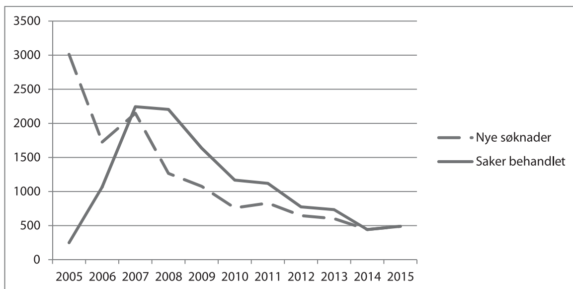
Figur 2.1 Utvikling – søknader mottatt og behandlet i perioden 2005–2015