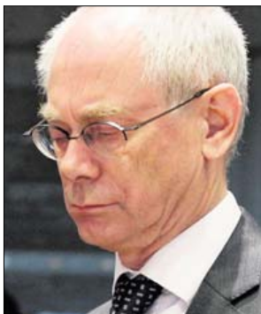
EU-præsident Herman van Rompuy kommer til Danmark om en uge.

– indebærer, at kommissionen inden årets udgang laver en vækstundersøgelse og varsler, hvis lande makroøkonomisk er ude af balance, og kommer med anbefalinger til, hvordan det kan rettes op.