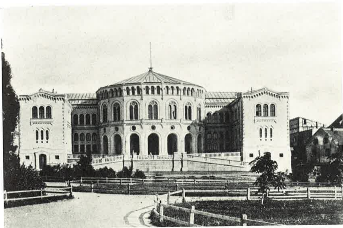
Stortingsbygningen ferdig i 1860-årene.

Men det tyktes Folket og det tyktes dets Regjering, at som det var det hensigtsmæssigste, saa var det ogsaa sømmeligst, at Stortinget havde sit eget Hus, og man begyndte at gjøre Forberedelser til dets Opførelse. Mine Brødre, det er baade ufornuødent og mindre passende, om vi nu ville tale om den lange Tid, som disse Forberedelser krævede, om det meget Arbeide, de mange Forhandlinger og Beslutninger, som knytte sig dertil; jeg vil alene paaminde om, at Stortinget har haft fuldkommen frie Hænder, at det er Stortinget, som har bestemt Stedet, hvor dette Hus skulde staa, og hvordan dette Hus skulde være. Men vi ville frembære vor Tak til Styrelsen, der har lagt for Dagen, at det var dens Ønske som dens Bestræbelse, at Stortinget maatte faa en Bolig, Nationen værdig, værdig dens Repræsentanter og den Gjerning, de der have at udføre. Vi ville frembære vor Tak til de Mænd, hvem det overdroges at have Opsynet med denne Bygnings Opførelse, vi ville takke dem for den ufortrødne Flid, hvormed de have udført dette Hverv. Vi ville takke